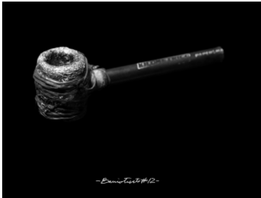
Esto es una pipa. Barriotriste # 12. Fotografía. 160 x 120 cms. 2008. Camilo Restrepo Z.

Finalmente, vemos, desde atrás, enfrentar el suspenso del salto y de lo que aún no sucede. Además, el impulso se realiza en una dirección que abandona a quien mira. El niño no sólo nos da la espalda sino que avanza con independencia en el espacio y en el tiempo escapando a nuestras coordenadas. Tal vez sea esto lo que provoca en el espectador la idea de saberse en el pasado: cuando observamos a Ángel somos pasado.