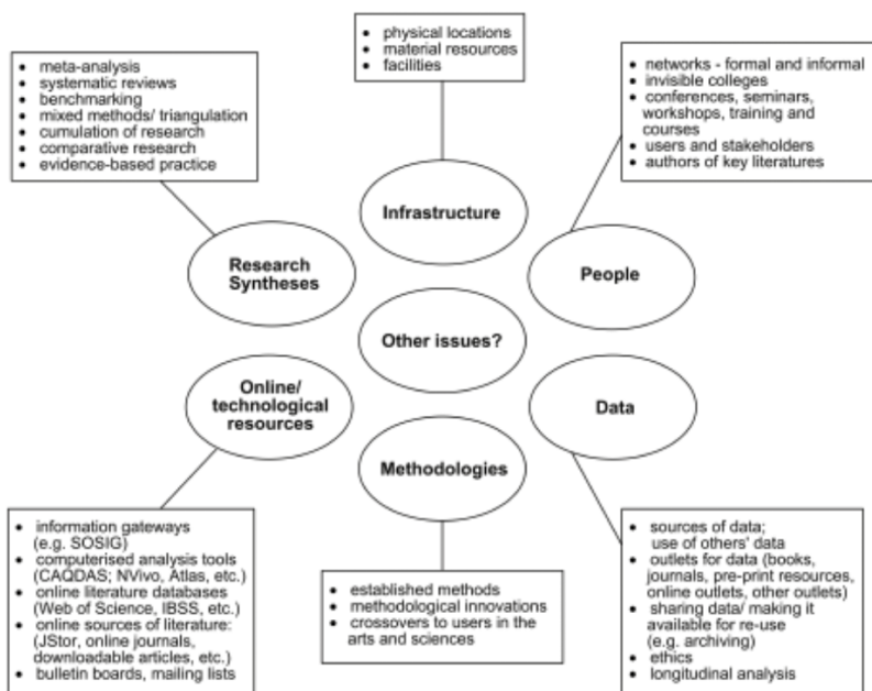
Figura 1. Esquema general utilizado en la consulta de recursos de la investigación cualitativa (Fuente: Henwood&Lang, 2005, p.13)

En un segundo momento, Henwood y Lang (2005) analizan el ejercicio de los investigadores anglosajones, el cual se resume en la Figura 1. Son seis aspectos clave, de la investigación y la relación entre los investigadores, que se deben tener en cuenta: la infraestructura, los datos, las metodologías, los resúmenes de las investigaciones, los recursos tecnológicos y las personas; este último aspecto es clave en la creación de redes para dar a conocer las investigaciones.