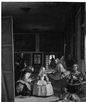
Imagen 8. Diego Velázquez, Las Meninas , 1656, óleo sobre lienzo, 318 cm × 276 cm. Museo El Prado. La pintura de Velázquez representa el modo en que la construcción visual, a través de detalles de segundo plano, suscita una animación temporal, una conversión en literatura por mediación del ensayo.

respuesta psicológica. Lo que en Las Meninas aparece como aporía revela al escritor la posibilidad de que, dentro del mundo construido por la pintura, se insinúen otros mundos, en una suerte de imaginación elevada a la segunda potencia, gradación que culmina, paradójicamente, en un efecto de realidad. Este efecto, por demás, tal como se manifiesta en el texto, intenta reproducir los juegos de representación y las alusiones problemáticas al marco que se hallan en las obras de la imaginación barroca.