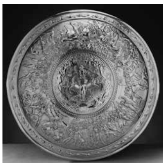
Imagen 1. Philip Rundell, El escudo de Aquiles , 1821, plata dorada, 90.5 x 90.5 x 10.0 cm, Royal Collection , Londres. Recreación decimonónica, ilustrativa, si se quiere, de la descripción de Homero.

La figura de la écfrasis, como se sabe, tiene antecedentes en el mundo clásico, el más recordado de los cuales (y, hasta cierto punto, modelo para las écfrasis posteriores) es la descripción del escudo de Aquiles fraguado por Hefestos, la cual aparece en la Iliada (Homero, cap. XVIII: 478-606). La figura de la écfrasis, tal como lo señalan los teóricos, tiene como objetivo hacer una reproducción de lo visible, razón por la que, en sus propósitos centrales, buscaría, principalmente, hacer una mimesis de otra mimesis y producir un efecto de presencia. Es decir, al reproducir con palabras una imagen artística se estaría buscando hacer una especie de traslado del mundo de lo visible al mundo de lo legible (Guasch, 2003: 216).