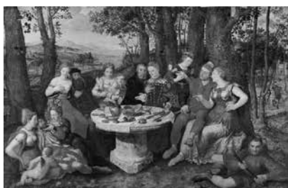
Imagen 6. Pieter Pourbus, Una alegoría del amor verdadero , 1547, pintura sobre madera, 132.8 x 205.7 cm. Wallace Collection . A esta obra, Gómez Valderrama la llama en su texto de 1956 Fiesta alegórica del amor . La sustitución puede verse como un rasgo de apropiación imaginaria, pues enfatiza en el carácter celebrativo de la pieza visual y la traduce retirando el adjetivo “verdadero”, que da un sentido espiritual a la composición.

aporta no sólo información de primera mano acerca del contacto que el autor tuvo con los museos en Londres, sino también su visión sobre el arte de la pintura y la manera en que ella puede tener una relación con la literatura. 5 De hecho, en este texto podemos encontrar la síntesis de su postura estética ante los límites que existen entre práctica literaria y práctica pictórica. Aunque el texto, dividido en veinticinco capítulos, se dedica a los más variados aspectos de la vida de la capital inglesa, en su tono de presentación visual domina el intento plenamente ecfrástico de “hacer ver” calles, cementerios, casas y, en general, todo el paisaje brumoso de la urbe. Ahora bien, dentro de ese propósito general de hacer ver, tiene una importante presencia el espacio dedicado al arte de la pintura, con el cual el autor tiene contacto en sus visitas a la National Gallery , narradas con detalle a lo largo del texto. En este caso, la pregunta no es mítica como en el caso anterior, sino teórica, pues se repiten interrogaciones sobre la limitación temporal de la pintura (el viejo dilema presente en la teoría estética) y se postula, sobre todo, una relación del arte visual con la vida cotidiana. De modo que la écfrasis abandona su alcance puramente descriptivo y bordea los límites de un análisis que compromete la pregunta por la identidad (y posible interacción) de las artes.