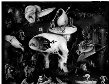
Imagen 2 (Fuente: http://goo.gl/Kfq200 ). Hieronymus Bosch, “El infierno” (detalle), panel derecho de El jardín de las delicias (tríptico), c. 1480-1490, óleo sobre tabla, 2,20 x 97, Museo El Prado. Obra que, en uno de los cuentos de Gómez Valderrama (1996: 81-83), sirve para la actualización de la experiencia del infierno, argumento también socorrido en los ensayos que integran Muestras del diablo (1993).

La obra ensayística y periodística de Pedro Gómez Valderrama se concentra en los textos críticos que escribió para la revista Mito (publicación de la que fue uno de sus fundadores y animadores) y, principalmente, en los ensayos literarios de mayor extensión: Muestras del diablo (Gómez Valderrama [1958], 1993) y Los ojos del burgués (un año en la Unión Soviética) , de 1971.