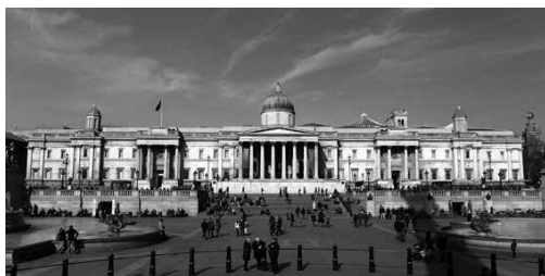
Imagen 5. Panorámica de la entrada a la National Gallery de Londres, cuya colección suscita algunas de las reflexiones del ensayo “Londres” (Gómez Valderrama, 1956).

muestra claramente que “con la oscuridad de la noche las criaturas de ese mundo extraño cobran una vida propia y verdadera” (Gómez Valderrama, 1993: 138). La capacidad que tienen la catedral gótica y sus decoraciones escultóricas para justificar la intemporalidad de la experiencia demoníaca se traslada, de este modo, hasta la realidad de cada hombre, de quien el ensayista se declara portavoz, con lo que la imagen y la experiencia que la acompaña adquieren una especie de carácter ejemplar. El rostro de la gárgola es, de esta manera, la encarnación de la vivencia permanente del infierno.