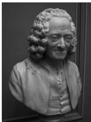
Imagen 4. Jean-Antoine Houdon, Busto de Voltaire con peluca , 1778, mármol, 52.7 × 45.5 × 33.3 cm, National Gallery of Art . Si la risa volterriana está en continuidad con la de la gárgola es porque la imagen sirve como apoyo a una tesis que conecta dos gestos distantes en la historia, aunque próximos en su simbología intelectual.

sirven como base para una tesis y para una cadena argumental derivada dentro del ensayo literario. (Riffaterre, como ya se mencionó, parte del análisis de los contenidos mitológicos de una obra de Tiziano, que sirven como base para las ideas sobre el alma y el erotismo, aparecidas respectivamente en Paul Claudel y Phillipe Sollers [Riffaterre, 2000]). En cierta medida, si el cuadro de Tiziano le sirve a Claudel para invocar el argumento de la “carne espiritualizada”, en Gómez Valderrama la estatuaria gótica funciona como una confirmación del argumento de “la actualidad del infierno” y de una risa convertida en emblema de libertad de pensamiento.