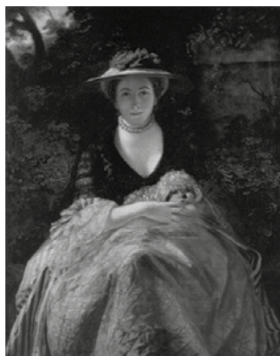
Imagen 7. Sir Joshua Reynolds, Retrato de Nelly O'Brien, 1762-1764, óleo sobre lienzo, 126 x 110 cm. Wallace Collection. Esta es otra de las obras comentadas por el ensayista.