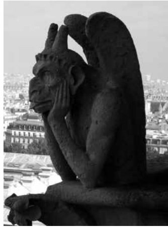
Imagen 3. Gárgola sobre la catedral de Notre-Dame (1163-1335), motivo visual central del ensayo “El engañado” (Gómez Valderrama, 1993).

En el caso del ensayo referido, además de la actualización del problema del demonio y el infierno, encontramos un vínculo adicional con la aspiración de una restitución de la obra a la condición presente: la referencia, en diversos puntos del ensayo, a la catedral gótica y a sus aspectos formales, como un elemento que da soporte a la discusión sobre la actualidad de la experiencia infernal y demoníaca que se quiere presentar. En este punto, la écfrasis sirve para fundamentar el argumento de la omnipresencia infernal y dar apoyo referencial para la defensa de una tesis de tipo suprahistórico. En parte, el arte es útil en el ensayo para probar la actualidad humana del problema del infierno, dadas la contundencia y la pervivencia de sus representaciones. Razón por la que el Bosco o Grünewald vienen a ser retratistas de una realidad psicológica, de un estado del alma que es permanente en la humanidad y que demuestra cómo las torturas ideadas por el hombre del siglo XX definen la actualidad de tales visiones. ¿Qué mejor opción, entonces, que acudir al impacto presente de la imagen para un argumento histórico que pone de presente la actualidad de la imaginación demoníaca?