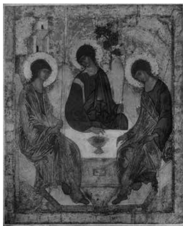
Imagen 9. Andrei Rubliov, La trinidad , c. 1411, témpera, 142 cm × 114 cm, Galería Tretyakov, Moscú.

Solamente un sentimiento religioso de extraordinario poder permite la creación de un arte pictórico popular como es el del ícono. La pintura de caballete evoluciona lentamente, por su propia virtud, en otros sentidos. Sólo en determinados momentos se encuentran las dos, cuando buscan en la pintura del ícono nuevas expresiones para sondear el alma y el mundo eslavos (Gómez Valderrama, 1971: 106).