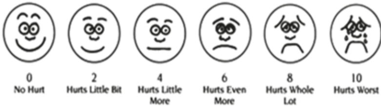
Figura 2. Escala de dolor Wong-Baker.

c) El cuestionario del dolor de McGill (CDM).