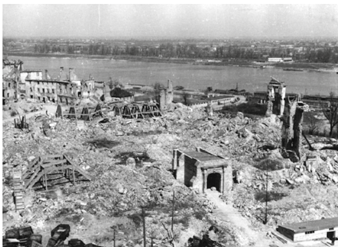
Imagen 3. Ruinas del Castillo Real de Varsovia. Puerta Grodzka, costado oriental, 1947.

Por esta causa, no es de extrañar que la elección de la sociedad al terminar la guerra fuese la reconstrucción de toda la ciudad, tal y como estaba y donde estaba. Así, sus habitantes reconstruyeron Varsovia de acuerdo con el modelo de su antigua arquitectura, en la segunda mitad del siglo XX. Tampoco es de extrañar que, aún con estas características, la ciudad de Varsovia obtuviera en 1980 la declaratoria de la UNESCO como patrimonio de la humanidad, por ser ejemplo destacado de reconstrucción casi total de una secuencia histórica que se extiende desde el siglo XIII hasta el XX. En palabras de Tung: