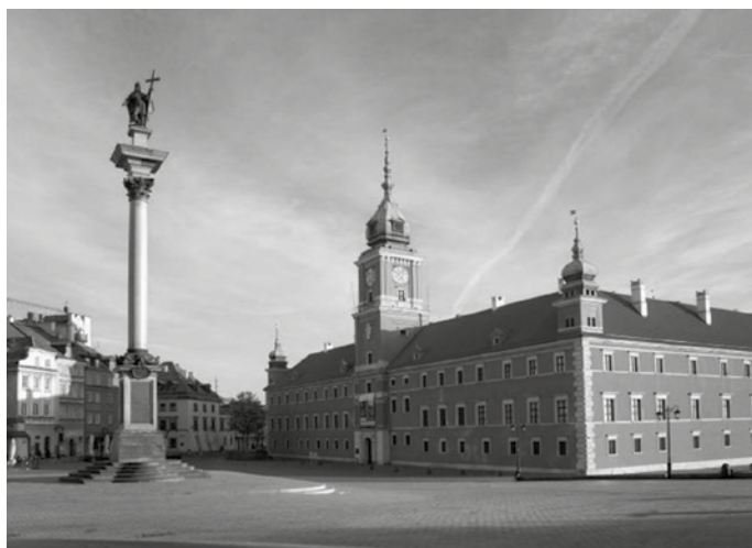
Imagen 4. Castillo Real de Varsovia, época actual. (Fuente: http://bit.ly/1tncSna ).

Las ciudades -de ganadores y perdedores- fueron reconstruidas por su significado en la mente de los habitantes; lo que contenían de la memoria de los pueblos que las erigieron, habitaron y desarrollaron. La ciudad es el objeto compuesto por pequeños escenarios, en los cuales se construye una identidad a través de la memoria.