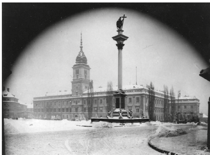
Imagen 2. Castillo Real de Varsovia, 1924.

Los alemanes buscaban aniquilar al pueblo polaco mediante la destrucción de sus testimonios memoriales (imagen 3). Los polacos querían sobrevivir a la guerra preservando a como diera lugar esos mismos testimonios. Ambos proyectos, el de resistencia polaca y el de ataque alemán, repercutieron en el objeto testimonio que era la ciudad. Aunque los dos comportaban implicaciones diferentes, uno de destrucción, el otro de supervivencia, ambos tenían en común el objeto testimonio de la memoria histórica colectiva. La destrucción de la ciudad fue solo una consecuencia lógica, debido a que la ciudad es el escenario de la actividad humana y, por lo tanto, es la que reúne la mayor cantidad de objetos testimonio.