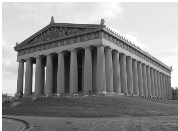
Imagen 5. Partenón de Nashville, Tennessee. (Fuente: http://bit.ly/28qKNLv ).

El problema con el uso de las copias se debe a la interpretación estática del concepto de la originalidad de los materiales. Las copias han tenido críticas a favor y en contra, por el valor de falsedad que pueden llegar a tener los objetos, que atenta contra la originalidad. Las opiniones se encuentran divididas. Por un lado están los detractores de las copias, desde Riegl (1987) hasta Capitel (1988). Por otro lado están los defensores, como Benévolo, Sola-Morales y Beltrami (citados en Hernández, 2007: 36); verbigracia, Beltrami sostiene que es legítimo realizar copias exactas sin ninguna mutación, con los mismos materiales e idéntica decoración si tenemos documentación histórica y gráfica que lo permita. Como ejemplos de copias se pueden mencionar el Partenón de Nashville, el castillo Guédelon, en Francia, diseñado por el arquitecto Jacques Moulin, y el pabellón de Barcelona, en España.