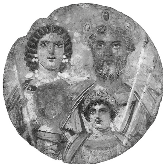
Imagen 1. Tondo con la familia de Septimio Severo. Pintura al temple sobre madera (circa 199 d. C.). Museo Staatliche de Berlín..

trario, si el juicio del pueblo y el senado era benéfico, el emperador muerto se convertía en un dios, y se permitía el culto a su persona con la consecuente construcción de testimonios sobre su gobierno y su vida, así como de monumentos, templos y escritos en su honor. El templo de Julio César divinizado, edificado por Augusto en el 29 a. C., era una apoteosis a su memoria (Sear, 1998: 58).