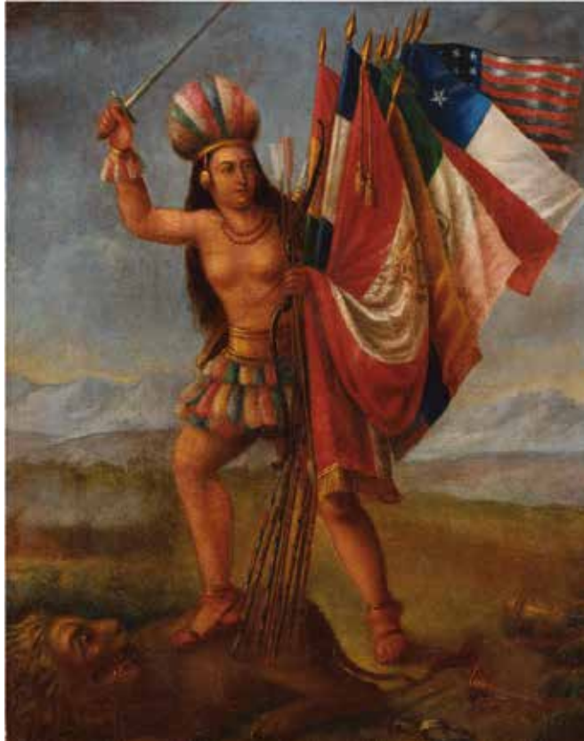
Allegoría de la Unión Americana. Artista: Mariano Florentino Olivares 1865 Óleo sobre tela adherida a nórdex 51.5 x 40.5 cm. Museo de Arte de Lima. Donación Jorge Roa.