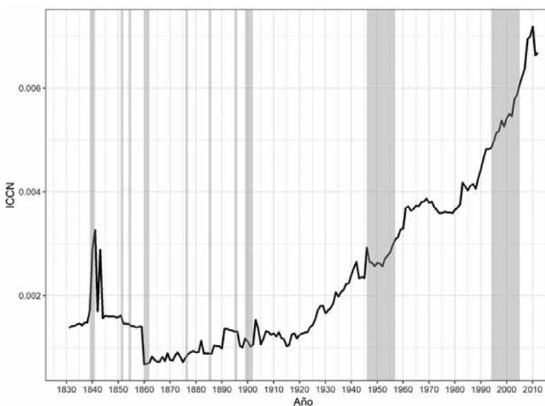
Figura 1. Capacidades materiales nacionales y guerras civiles, 1830-2012