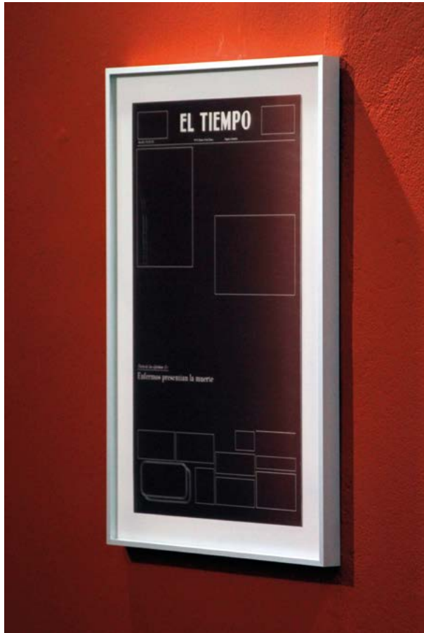
Felipe Florez. De la serie Cuando Todas las Cosas Reposan , 2016. Detalle. Grabado láser sobre acero inoxidable. 65 × 40 cm.