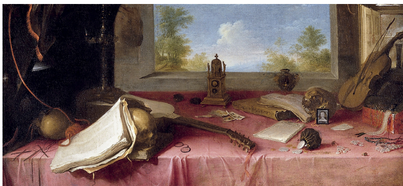
Imagen 10. Andrés Deleito, Vanitas (siglo XVII)