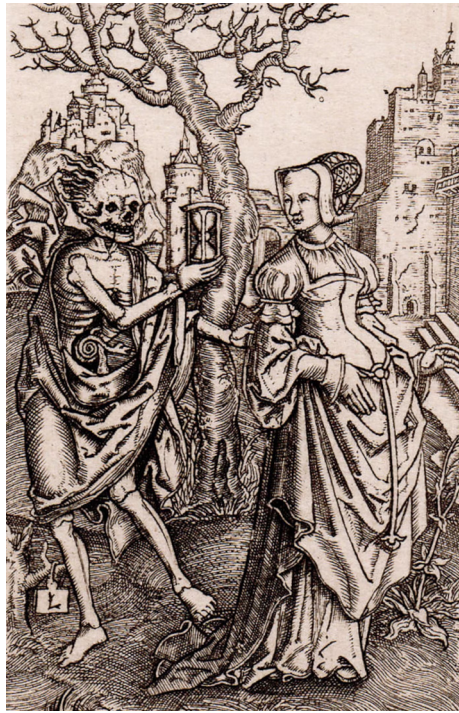
Imagen 4. Lucas van Leyden: La muerte con un reloj de arena persiguiendo a una dama noble (c. 1717-1730)

Fuente: KCM Galleries, https://n9.cl/bma3w