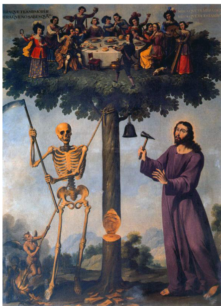
Imagen 2. Ignacio de Ríos: El árbol de la vida (1653), catedral de Segovia

Esta imagen terrible de la muerte fue potenciada por la ideología contrarreformista y más exactamente por el pensamiento jesuítico y sus seguidores, que creían que la imagen de la muerte –como base de meditación– era el más eficaz antídoto contra la vanidad del hombre (Pradillo, 1995, p. 127).