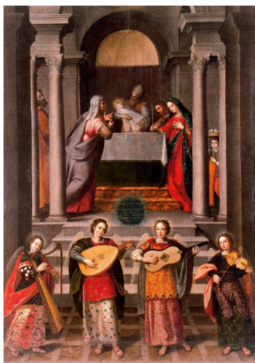
Imagen 11. Diego Valentín Díaz, La presentación de Cristo en el templo (primera mitad del siglo xvii)