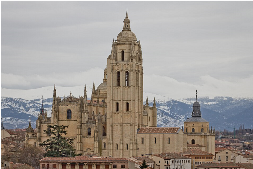
Imagen 1. Catedral de Segovia (España)

La catedral de Segovia (imagen 1), conocida como “la Dama de las Catedrales”, es una obra maestra del estilo gótico español. Construida entre 1525 y 1768, se erige en la Plaza Mayor de la ciudad, destacándose por su gran altura y elegancia. En cuanto al exterior, uno de los aspectos más distintivos de su fachada principal es la imponente torre de 88 metros. En su interior, resalta su retablo mayor, los magníficos vitrales y varias capillas con exquisitas manifestaciones pictóricas y escultóricas. En particular, en este trabajo nos situaremos en la capilla de la Concepción, ubicada a los pies del templo, junto a la puerta del Perdón.