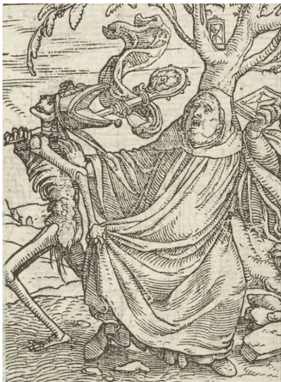
Imagen 3. Hans Holbein: “El abad”, La danza de la muerte (1523-1525)