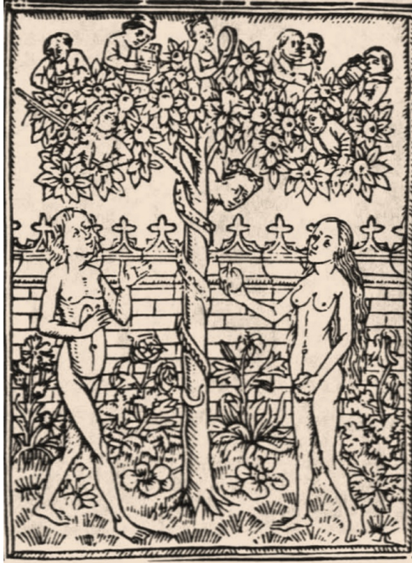
Imagen 7. Anónimo, Pecado original (s. xv)