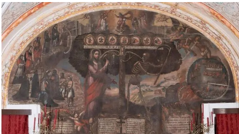
Imagen 8. Anónimo: El árbol de la vida (siglo XVII), iglesia de san Roque de Arahal (Sevilla)

ejemplos mencionados, pues se recogen otras escenas adicionales y alegorías alrededor del árbol –que es el núcleo–, en un programa más complejo que, en esta ocasión, no será objeto de estudio. 7