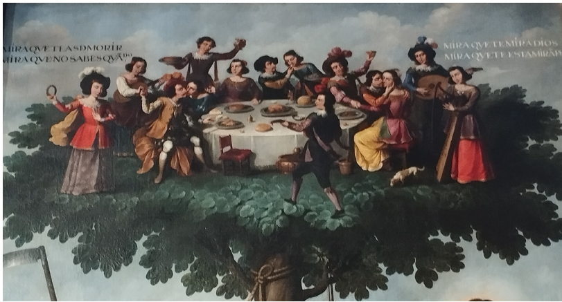
Imagen 6. Ignacio de Ríos: El árbol de la vida (1653), detalle superior