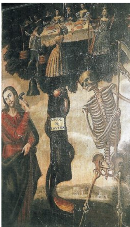
Imagen 12. Anónimo: El árbol de la vida (siglo XVII), antiguo convento de Lauras de Valladolid