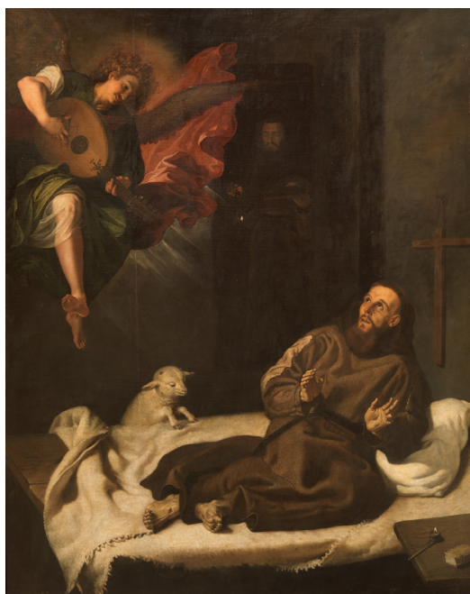
Imagen 9. Francisco Ribalta, San Francisco confortado por un ángel (c. 1620)

Capuchinos de la Sangre de Cristo en Alboraya (Valencia), hoy albergado en el Museo del Prado, en Madrid. En un estilo naturalista, san Francisco, en éxtasis, parece sentirse reconfortado con la música procedente del ángel músico que aparece en el lateral izquierdo. Si bien se aprecian detalles organológicos de la parte frontal del laúd –como el elevado número de cuerdas, la presencia de trastes, un clavijero ligeramente doblado y la profusa decoración–, el principal valor responde al sentido simbólico de la música, pues el santo, representado en un éxtasis místico, se ve confortado por la melodía, de acuerdo con la teoría de los afectos y la capacidad terapéutica de la disciplina.