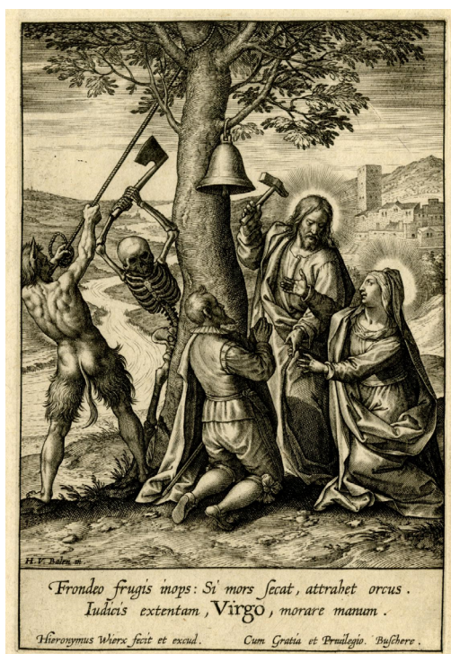
Imagen 5. Hieronymus Wierix, a partir de pintura de Hendrik Van Balen: Estampa (anterior a 1619)