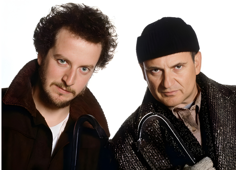
Figura 5. Fotografía promocional de los ladrones

caracterización visual (fisionomía y vestuario) reflejada en la música. De ahí la elección del compositor hacia unas características que remiten al cine mudo, e incluso a la animación.