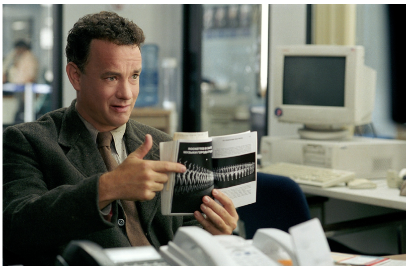
Figura 7. El personaje de Viktor Navorski en una escena del filme