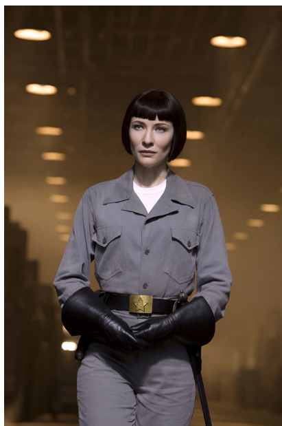
Figura 10. Foto promocional del personaje de Irina