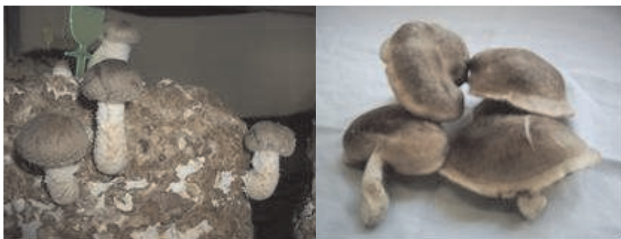
Figura 3: cuerpos fructíferos del tratamiento #11. a) Fructificación 4 días después de la obtención de los primeros primordios, b) Shiitake cosechado

En la fotografía (figura 3) se pueden observar los cuerpos fructíferos del tratamiento #11 con 4 días de formación del cuerpo fructífero y una vez cosechados.