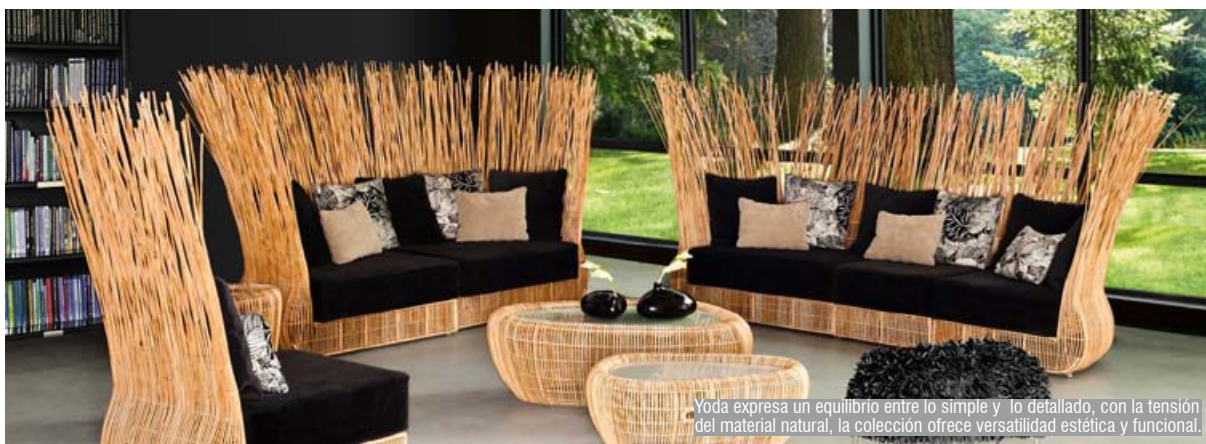
Yoda expresa un equilibrio entre lo simple y lo detallado, con la tensión del material natural, la colección ofrece versatilidad estética y funcional.

ellos ubicados en Italia, otros en Alemania, hasta 1994, cuando decide retornar a Estados Unidos, con un poco más de experiencia para probar suerte en alguna casa importante de diseño del país, pero como él mismo asegura: “No habían oportunidades de trabajo, todos los puestos deseados estaban ya ocupados, incluso los graduados de Harvard estaban manejando taxis”. Por estos motivos Kenneth decidió regresar a su tierra y en 1996 implementar los conocimientos aprendidos en el instituto Pratt, integrándolos con la manipulación tradicional de fibras y maderas propias de su isla, para después comenzar a crear sofás, mesas, sillas, cunas, de una forma orgánica, impecablemente dotadas de la belleza estructural que siempre lo ha caracterizado, que rompe geometrías estándar, como la mesa de centro, los muebles de jardín, inspirándose en las formas propias del mundo natural (Cobonpue, 2012).