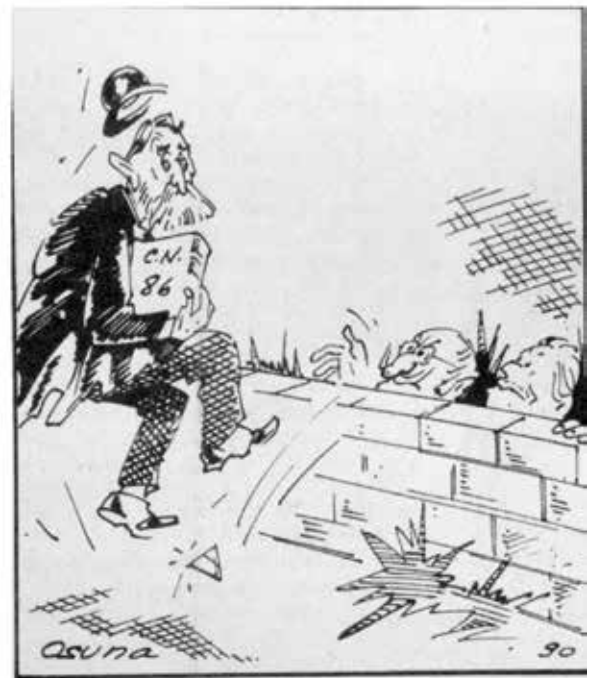
Osuna, H. (4 de marzo de 1990). La séptima papeleta . Bogotá: El Espectador .

La abogada eafitense también encontró posturas divergentes de los caricaturistas sobre un mismo acontecimiento. Por ejemplo, frente a la Séptima papeleta, la postura de Osuna contrasta con la de sobre el fallo de la Corte Suprema de Justicia.