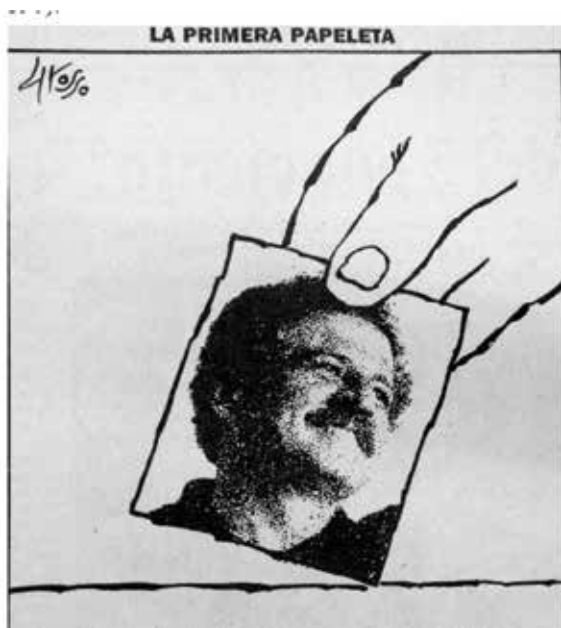
Grosso, J. (11 de marzo de 1990). La primera papeleta . Bogotá: El Tiempo .

Estudiar cómo la literatura, el cine o la caricatura muestran el derecho permite aproximarse a temas jurídicos de manera distinta, si se tiene en cuenta que el derecho no solo genera dichas expresiones, sino que las nutre, puntualiza María Virginia.