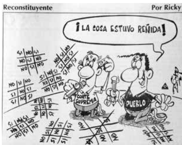
Betancur, R. "Ricky". (11 de octubre de 1990). Reconstituyente . Medellín: El Colombiano .

Lo anterior confirma que “la caricatura colombiana tiene un gran potencial para ser estudiada desde el derecho”, es decir, “puede utilizarse como una fuente primaria de análisis del derecho por su capacidad para representarlo desde una perspectiva histórica e, inclusive, en temas de actualidad”, concluye Diana Gil en su trabajo de grado.