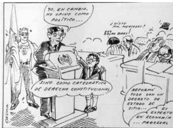
Gaviria, el jurista Por OSUNA

Por su parte, reseña la abogada eafitense, la caricatura de Grosso muestra que “de las siete papeletas para las elecciones de marzo de 1990, una era en nombre del recién asesinado candidato presidencial Luis Carlos Galán. La visión de Grosso coincide con la posición de los historiadores constitucionales, pues el origen de la Séptima papeleta estuvo relacionado con el asesinato del liberal Galán”.