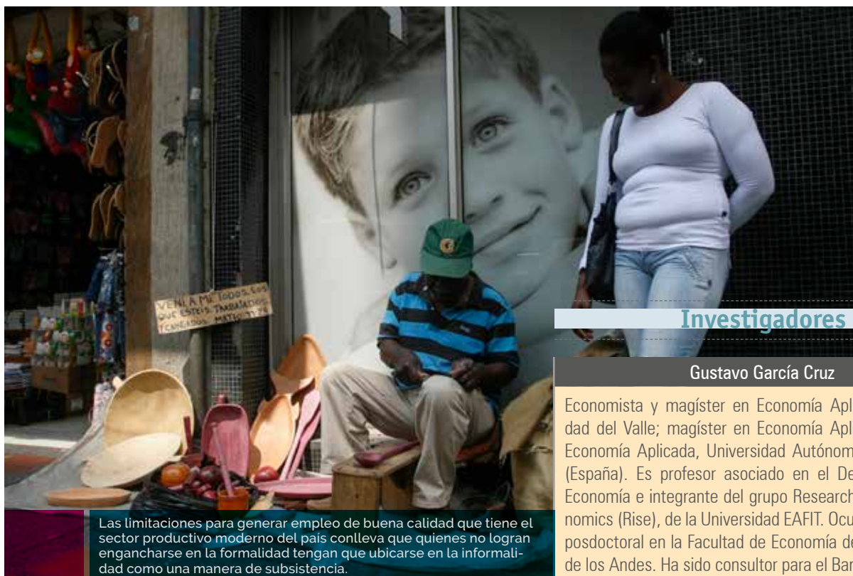
Las limitaciones para generar empleo de buena calidad que tiene el sector productivo moderno del país conlleva que quienes no logran engancharse en la formalidad tengan que ubicarse en la informalidad como una manera de subsistencia.