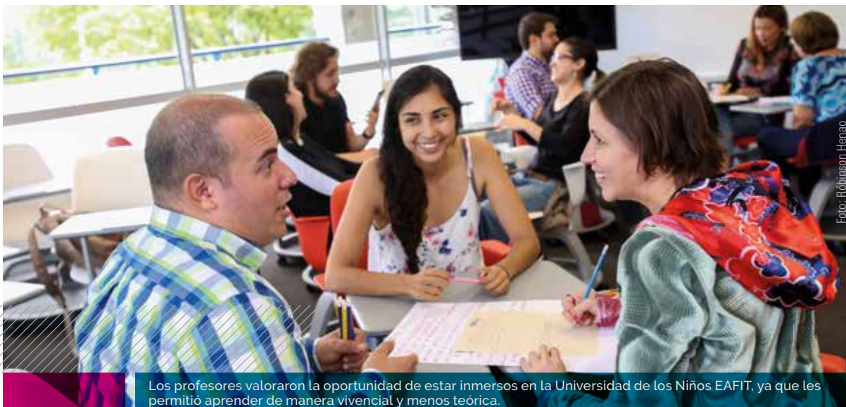
Los profesores valoraron la oportunidad de estar inmersos en la Universidad de los Niños EAFIT, ya que les permitió aprender de manera vivencial y menos teórica.