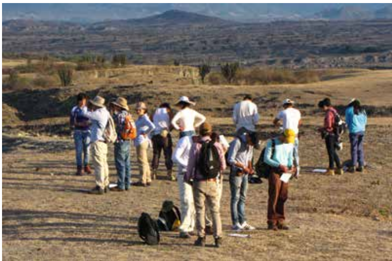
Las mañanas fueron utilizadas para el trabajo de campo estrictamente geológico; las noches, para conversar con la comunidad sobre la importancia de la región para la ciencia.