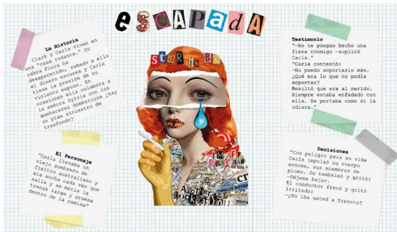
Esta imagen hace parte de uno de los fanzines creados por el semillero para incentivar la lectura de la escritora canadiense Alice Munro.