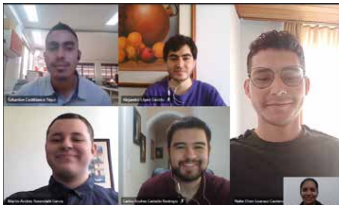
En las presentaciones virtuales, los estudiantes del semillero recibieron aportes para su proyecto de expertos de diferentes partes del mundo.

Grupo de investigación al cual está adscrito el semillero: Estudios en Mantenimiento Industrial (GEMI), Escuela de Ingeniería.