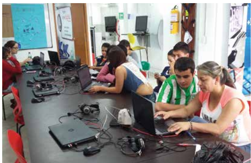
El semillero realizó talleres de capacitación a la comunidad sobre el uso de técnicas narrativas para la escritura de relatos de memoria histórica.

Solo en un municipio del Oriente antioqueño ganó el "Sí" para apoyar al acuerdo de paz que firmarían el gobierno del presidente Juan Manuel Santos y la entonces guerrilla de las Farc: Alejandría. En las demás poblaciones de la región