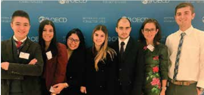
El semillero ha propiciado experiencias académicas para sus integrantes en la Conferencia de las Naciones Unidas sobre Comercio y Desarrollo, y en la Organización para la Cooperación y el Desarrollo Económicos (OCDE), entre otros organismos multilaterales.

la mayoría la obtuvo el "No", pese a que todos los pueblos sufrieron los más fuertes embates posibles de la violencia del conflicto armado.