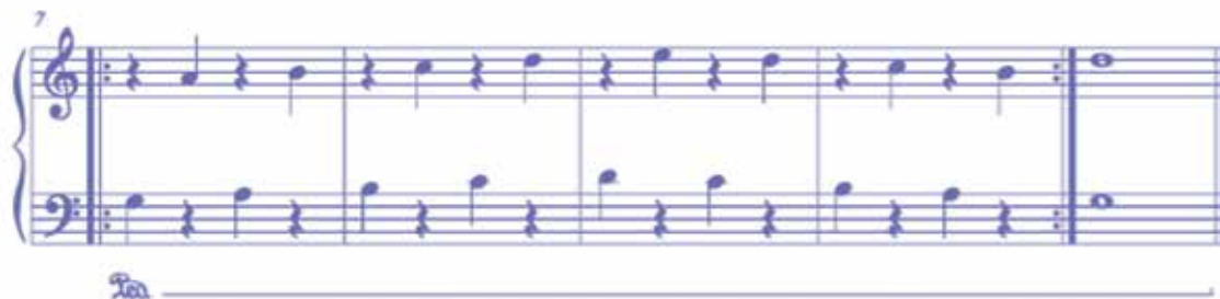
Ejemplo 1. Jhonnier Ochoa: ¿Para qué sirve el pedal de resonancia?, compases 7-11

Con esta pieza se puede introducir al estudiante al pedal de resonancia; también se pueden explorar el silencio y las duraciones de negra y redonda. Está escrita, en lo primordial, en manos alternas, lo cual permite un fácil acercamiento a la soltura de la muñeca (jugando con ambas en baja y sube). También se encuentra que cada mano empieza en notas distintas, lo cual le da mayor dinamismo. Ver el siguiente ejemplo: