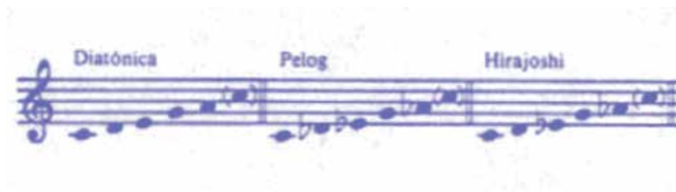
Figura 1. Escalas pentatónicas Fuente: Persichetti (1985, p. 48)

A continuación (figura 1), se muestran distintas conformaciones de escalas pentatónicas, con inclusión de las utilizadas en este grupo de obras: